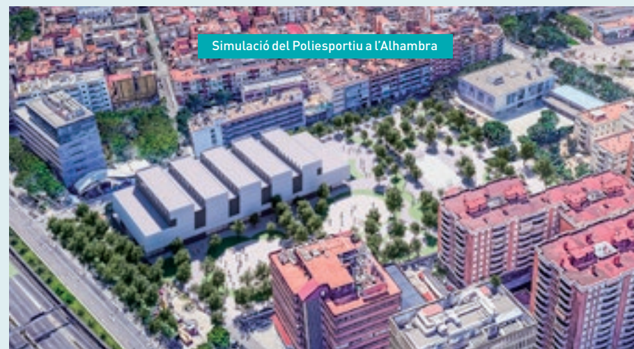
Simulació del Poliesportiu a l'Alhambra

TOTAL ZONA VERDA OPCIÓ ALHAMBRA: 20.710m 2