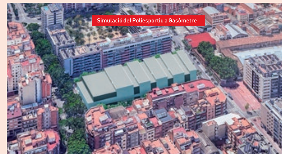
Simulació del Poliesportiu a Gasòmetre

TOTAL ZONA VERDA OPCIÓ GASÒMETRE: 17.500m 2